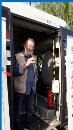
Ziehung der Gewinne von der Bürgermeisterin