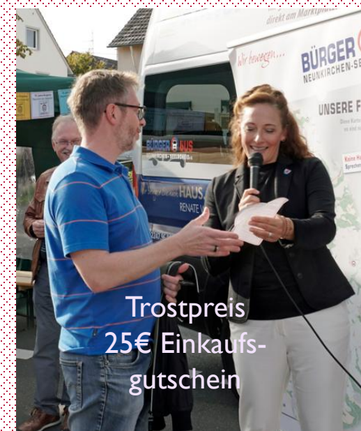
Trostpreis 25€ Einkaufsgutschein