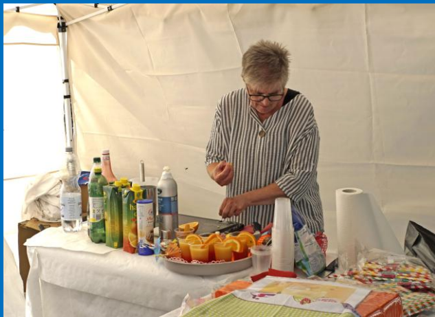
Cocktails werden zubereitet